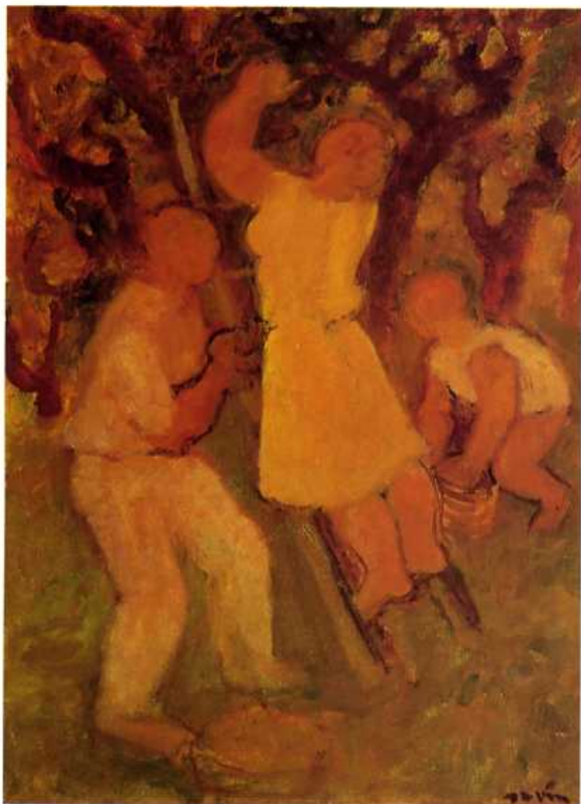
LA CUEILLETTE DES POMMES 54x73