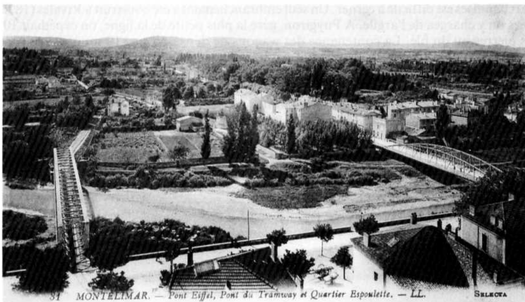
Vue en direction de l'est : le pont du tramway sur le Roubion à Montélimar, à gauche. A droite, le pont routier Eiffel construit en 1887.

Roubion et même à 6 km/h dans la traversée des agglomérations. La vitesse commerciale, compte tenu des 17 arrêts du parcours, se limitait à 17 km/h, c'est-à-dire la vitesse d'un cycliste mais davantage que celle de la diligence (13 km/h). Néanmoins une voiture publique à chevaux continuera à concurrencer le tram entre La-Bégude-de-Mazenc et Montélimar les jours de foire et les dimanches.