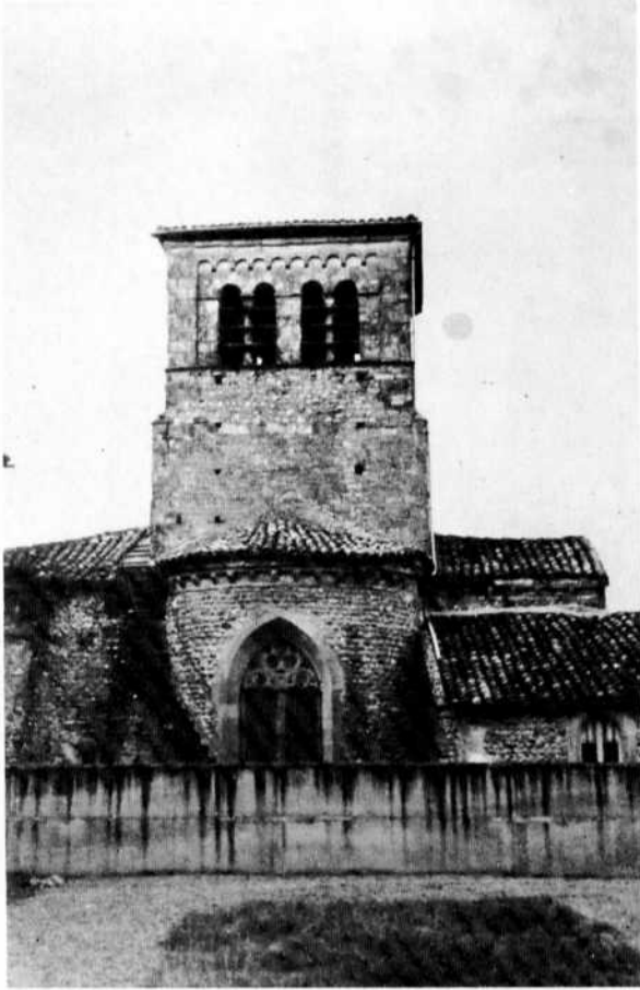
Chevet de l'église de Manthes.